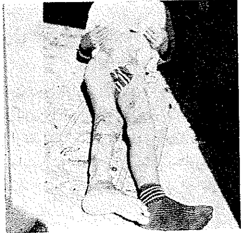
شکل ۲- بیمار پس از عمل جراحی و بهبودی